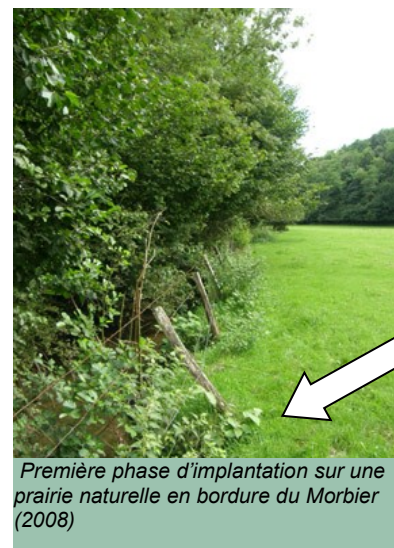
Première phase d'implantation sur une prairie naturelle en bordure du Morbier (2008)

L'association AGESEF en collaboration avec le ETBP Saône Doubs c'est lancé dans un programme d'information. Une journée technique intercommunale sera programmée pour l'automne 2008