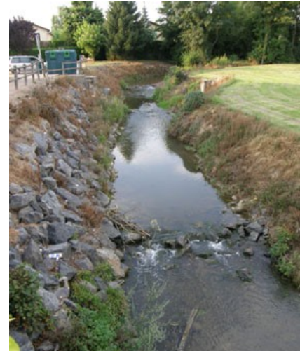
Etat désastreux de l'impact d'un produit phytosanitaire appliqué par méconnaissance des bonnes pratiques

Leur impact sur la faune est la flore peut être plus préjudiciable que l'effet recherché.